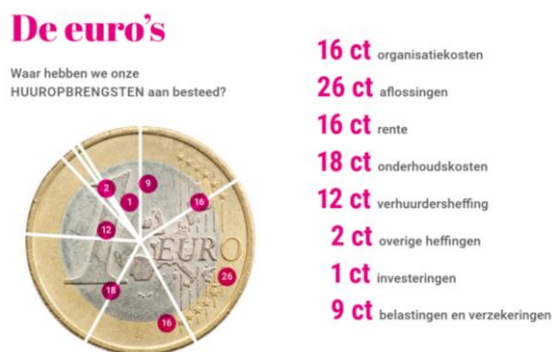
Figuur 2 Voorbeeld toelichting cijfers in de verkorte versie van het jaarverslag (Verkort JV 2018, p.12).

RKWBV heeft op de website toegankelijke informatie voor huurders en belanghebbenden opgenomen. Onder meer over geldende regelgeving en voorschriften, projecten in uitvoering en voorbereiding, en actuele informatieve berichten. Daarnaast draagt de 'team-pagina', waarbij de werknemers van RKWBV met foto worden weergegeven, bij aan de toegankelijkheid van de corporatie als geheel.