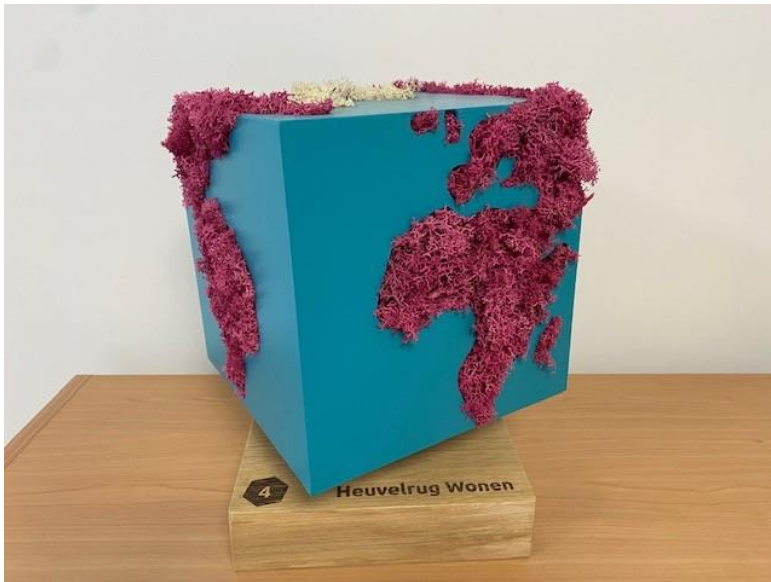
Afbeelding 1.4: Gewonnen duurzaamheidsprijs door Heuvelrug Wonen.

De visitatiecommissie kent twee pluspunten toe vanwege de significante daling van de gemiddelde energetische status van de voorraad en de gewonnen prijs voor de CO2-reductie.