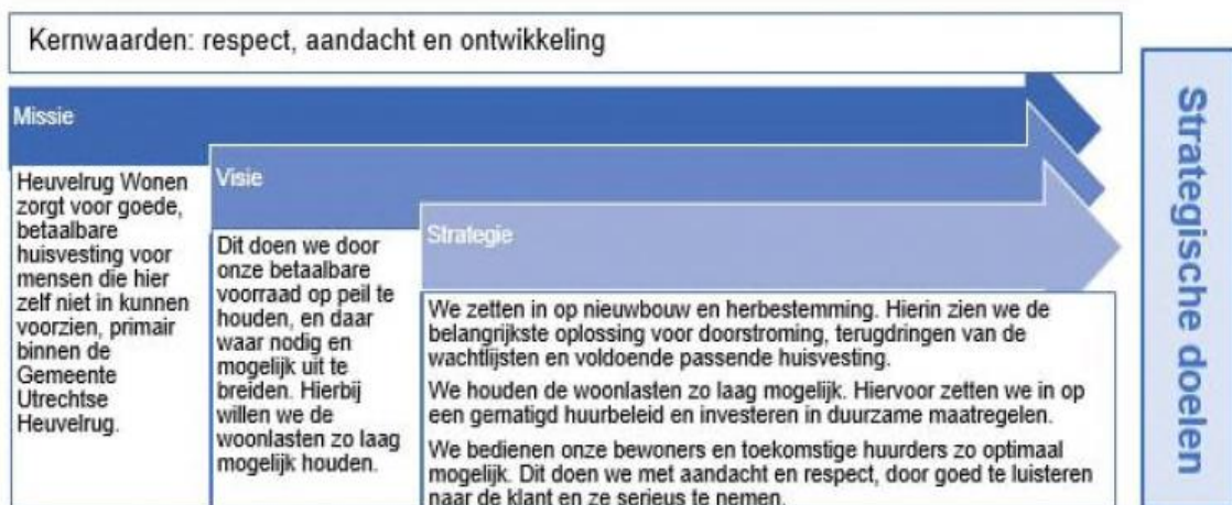
Figuur 4.1: Samenhang missie, visie, strategie en strategische doelstellingen 2018-2021

De belangrijkste randvoorwaarde bij het invullen van de doelstellingen is dat Heuvelrug Wonen financieel gezond is en blijft. Naast randvoorwaarden staan ook de kernwaarden respect, aandacht en ontwikkeling centraal in het dagelijkse handelen en de invulling van de doelstellingen.