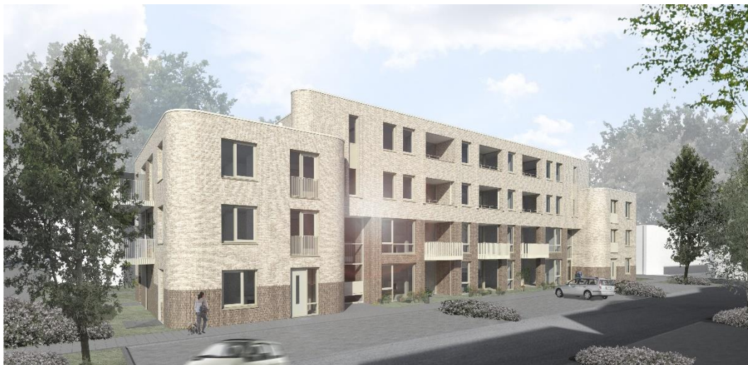
Afbeelding 1.2: Geplande nieuwbouw aan de Catharijnestraat.

In 2020 zijn door Heuvelrug Wonen in dat kadervoorbereidingen getroffen voor mogelijke nieuwbouwprojecten. Dit betreft onder meer: Haarweg in Maarsbergen, Kerklocatie de Groene tuinen in Driebergen en Catharijnestraat in Driebergen. In 2021 zijn twee projecten in uitvoering. In Cothen is het project Bloemenwaard in voorbereiding. In 2021 zijn daarnaast 14 duplexwoningen gesloopt en zijn daarvoor worden in 2022 in de plaats 22 woningen nieuwgebouwd. Om daarnaast extra zaken van de grond te krijgen heeft Heuvelrug Wonen herstructureringsdiscussies gevoerd met de gemeente en is een extra inspanning geleverd in het kader van de Nota inbreidingslocaties.