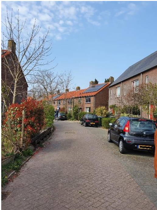
Afbeelding 1.6: Woningen voorzien van zonnepanelen.