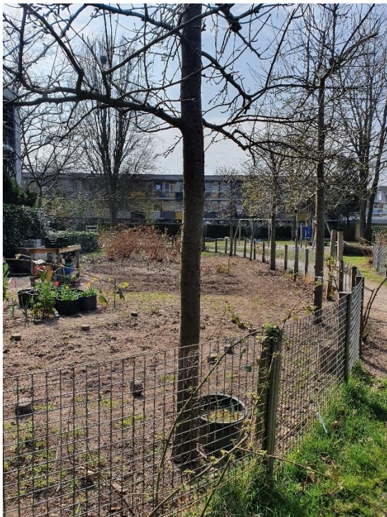
Afbeelding 1.1: Participatie van Heuvelrug aan de leefbaarheid in de vorm van een gemeenschapstuin.