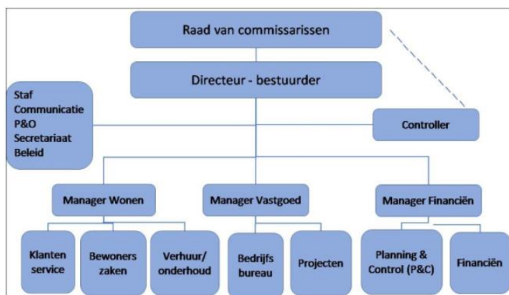
Figuur 1.1: Organogram Heuvelrug Wonen

De organisatie van Heuvelrug Wonen bestaat uit een directeur-bestuurder, een stafafdeling en de afdelingen wonen, vastgoed en financiën. Eind 2020 zijn er 40 medewerkers in dienst bij Heuvelrug Wonen. Het aantal fte's bedraagt 31,99. Het interne toezicht wordt verzorgd vanuit de Raad van Commissarissen (RvC). Eind 2021 bestond de RvC uit vijf leden.