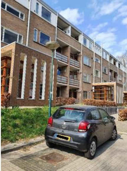
Afbeelding 1.3: Gerenoveerde woningen door Heuvelrug Wonen.

De visitatiecommissie kent één pluspunt toe vanwege het feit dat Heuvelrug Wonen volledig heeft voldaan aan de prestatieafspraken.