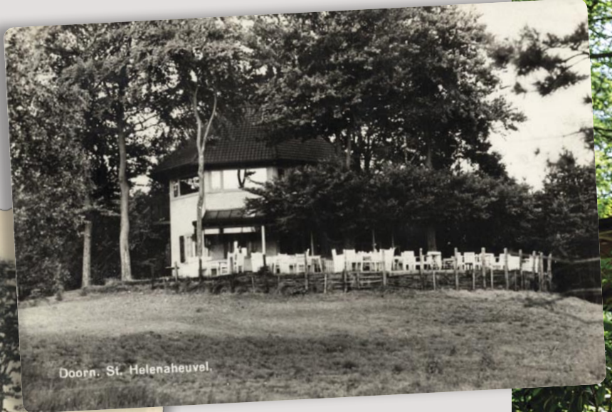
Gezicht op het chalet annex theeschenerij St. Helenaheuvel te Doorn. 1934, 1947 en 2024.